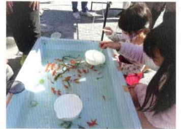
▲「これをすくおうかな?」