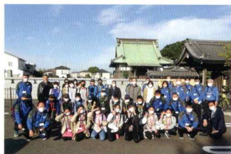
▲ これから出発します!!

昨年同様10月にハイキングを行いました。今年では中田寺を出発して片瀬江ノ島海岸を目指しました。春日神社や白旗神社でポイントラリーを行いながら片瀬江ノ島海岸で持参したお弁当を食べました。貝殻拾いや靴下を脱いでちょっぴり海に足を入れたりもしました。当日は日差しもあってとても良い天気でした。帰りは小田急線と地下鉄で中田駅まで戻り、中田寺で「参加賞」を受け取って無事に帰宅しました。また来年度も皆さんの参加をお待ちしています。