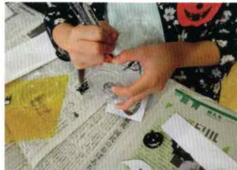
▲カップに絵を描くのはむずかしかった