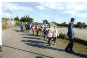
◀ 通信隊跡地を抜けて まだまだ歩くよ