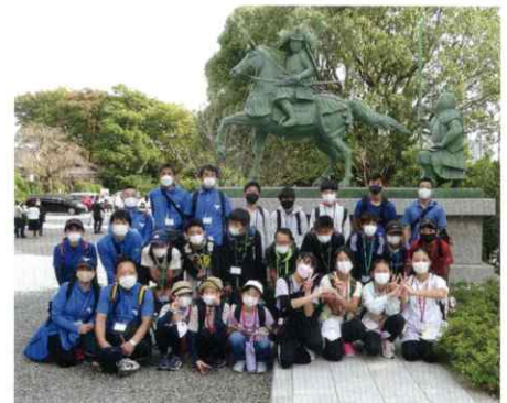
▲ スタンプラリーもしました!