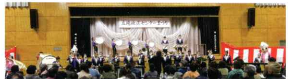
中田小マーチングバンド・東中田小マーチングバンド、立場地区センターまつりでの演奏