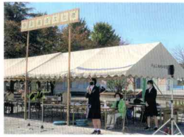
▲放送席から「茶会のお知らせです。」