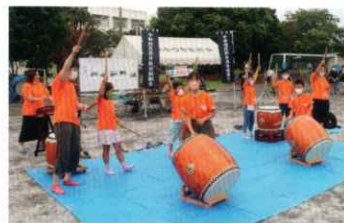
▲ 中田宮ノ前そよかぜクラブ和太鼓