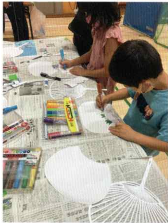
▲かっこいいうちわ、できるかな