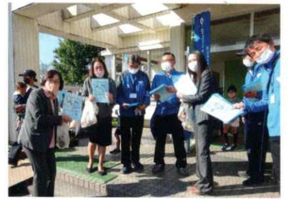
▲全市一斉統一行動キャンペーン中!

令和元年以来、3年ぶりに中田小学校のグラウンド/体育館で文化祭を開催しました。今回はコロナ感染防止対策として、西門での検温/手指消毒/マスク着用チェック、体育館での入館時間帯による鑑賞者の順次入れ替え、酒類飲食模擬店の中止、等々を考えて準備しました。出店テント数は例年の約4割減、作品出展数は約850点で対前回の3割減、やむを得ない事情による出演辞退もありましたが、出[店/展/演]者・運営スタッフ・来場のおお客様のご協力により、無事に開催することが出来ました。改めて皆様にご感謝申し上げます。