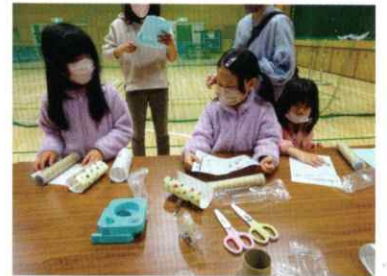
▲きれいな万華鏡を作るよ!