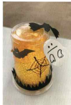
▲あかりがうまくなりました