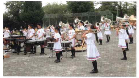
▲ 中田小マーチングバンド