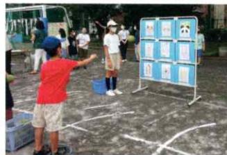
▲ 小中学校ゲーム大会