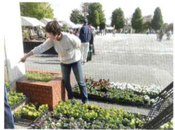
▲「この黄色のパンジーください。」