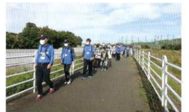
▲ 川沿いをみんなで「まだかなあ…」

昨年同様10月にハイキングを行いました。今年では中田寺を出発して片瀬江ノ島海岸を目指しました。春日神社や白旗神社でポイントラリーを行いながら片瀬江ノ島海岸で持参したお弁当を食べました。貝殻拾いや靴下を脱いでちょっぴり海に足を入れたりもしました。当日は日差しもあってとても良い天気でした。帰りは小田急線と地下鉄で中田駅まで戻り、中田寺で「参加賞」を受け取って無事に帰宅しました。また来年度も皆さんの参加をお待ちしています。