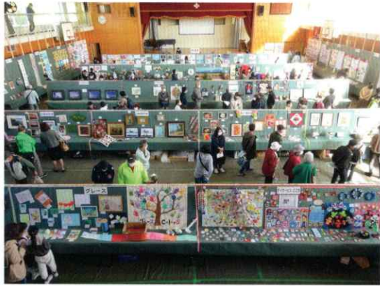
▲850点もの作品が並びました。