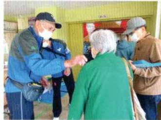
▲「入館テープを貼らせて頂きますね。」