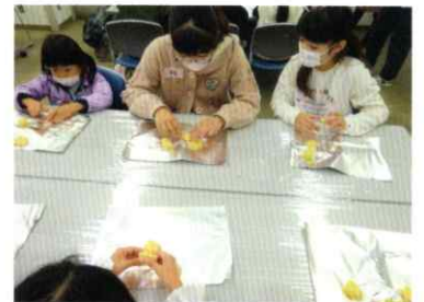
▲おいしいクッキーを作りました