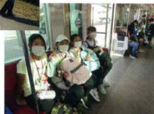
▲ 帰りは電車で座って帰ろう