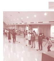
↑ JA女性部ポッチャ出張体験会

モルックは年齢にかかわらず楽しめる新しいスポーツです。当協議会ではモルックの研修を行っており多くの方に体験していただきたいと考えています。気軽に相談してください。