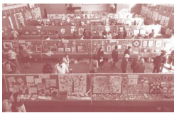
50点もの作品が並びました。

令和元年以来、3年ぶりに中田小のグラウンド/体育館で文化祭を令和4年11月に開催しました。