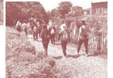
まさかりが淵ウォーキング→