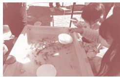
どれをすくおうかな～?